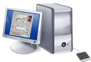
Lecteur de table FP153A

Le porte-clé peut remplacer le badge. Il peut être étanche, personnalisable... sur demande